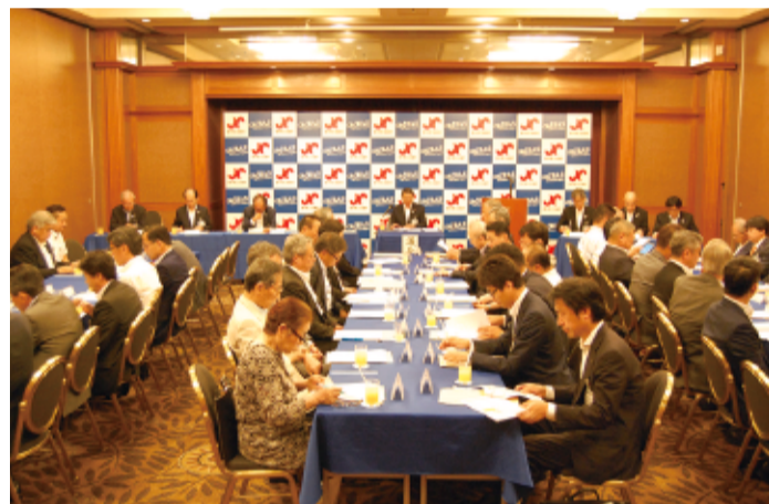
▲ 議事を進行する水上会頭

しかしながら、中小企業・小規模事業者や地域経済には、いまだ景気回復の実感が十分に浸透していないなかで、人件費や原材料コストの上昇に直面し、生産性の伸び悩みや人手不足の対応を迫られるなど、依然として不透明な状況が続くものと思われる。 われわれ産業界は、業界・分野を越えた英知を集め、この難局を乗り越える覚悟を持って未知なる成長分野へ果敢に挑まなければならない。 豊中商工会議所は、「元氣な豊中づくり」をスローガンに掲げ、正副会頭、役員議員そして事務局職員が力を合わせて「丸となり、まちづくり、ひとづくり」、企業づくりの重点分野において、会員企業を中心とする中小企業・小規模事業者への経営支援活動を積極的に展開してきた。 ●「まちづくり」では、国・大阪府等によって組成された「おおさか地域創造ファンド」を活用し、地域資源を活かしたビジネスプランの発掘や事業化を推進した。また、豊中市とも連携して「大阪国際空港」を活かしたまちづくりを推進し、「大阪国際空港及びその周辺地域活性化促進協議会」を通じて、意見要望活動にも積極的に取り組んだ。 ●「ひとづくり」では、厚生労働省委託事業として「地域ジョブ・カードサポートセンター」を運営し、採用・育成および人材マッチング支援