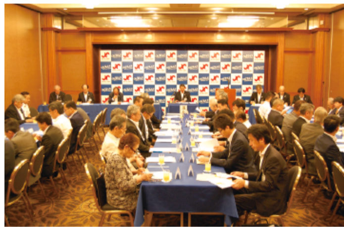
▲ 議事を進行する水上会頭

しかしながら、中小企業・小規模事業者や地域経済には、いまだ景気回復の実感が十分に浸透していないなかで、人件費や原材料コストの上昇に直面し、生産性の伸び悩みや人手不足の対応を迫られるなど、依然として不透明な状況が続くものと思われる。 われわれ産業界は、業界・分野を越えた英知を集め、この難局を乗り越える覚悟を持って未知なる成長分野へ果敢に挑まなければならない。 豊中商工会議所は、「元氣な豊中づくり」をスローガンに掲げ、正副会頭、役員議員そして事務局職員が力を合わせて「丸となり、まちづくり、ひとづくり」、企業づくりの重点分野において、会員企業を中心とする中小企業・小規模事業者への経営支援活動を積極的に展開してきた。 ●「まちづくり」では、国・大阪府等によって組成された「おおさか地域創造ファンド」を活用し、地域資源を活かしたビジネスプランの発掘や事業化を推進した。また、豊中市とも連携して「大阪国際空港」を活かしたまちづくりを推進し、「大阪国際空港及びその周辺地域活性化促進協議会」を通じて、意見要望活動にも積極的に取り組んだ。 ●「ひとづくり」では、厚生労働省委託事業として「地域ジョブ・カードサポートセンター」を運営し、採用・育成および人材マッチング支援