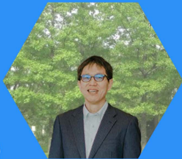
ロジック社会保険労務士法人 代表

労働人口の減少、採用コストの高騰… 「今いる」従業員を定着させ、育成して 会社の成長につなげましょう！