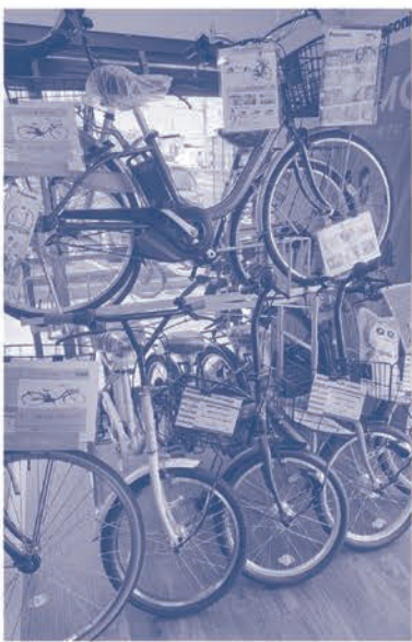
▲オススメの「塩野自転車」や電動自転車

●こだわりや強みを教えてください 個人店ならではのお客様一人一人に丁寧な接客を心掛けております。近年自転車事故が増え、原因の一つとして自転車の整備不良があります。タイヤやブレーキにも寿命があり(おおよそ2~3年)、それを超えての使用はタイヤの破裂やブレーキワイヤーが切れる等、重大な事故につながる恐れがあります。そうならないよう当店では無料点検を実施していますので安全で快適に乗るためにいつでもご相談下さい。