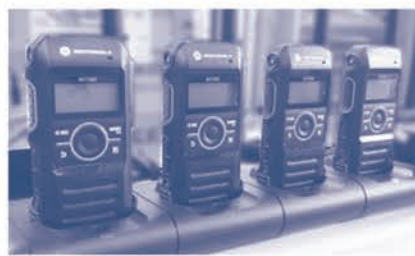
▲安心のレンタルサービスも好評

脈、技術力で顧客ニーズに合致する製品を選択して提案することが出来ます。無線専門店の多くは端末機器の販売が主で、無線の遠隔制御システムの設計から設置・調整・総合動作確認まで構築できる会社は少ないため、他社に無い強みがあります。なかでも、アメリカ警察の「911」(日本の110)のコールセンターにも導入されているテレックス社の「デイスパッチシステム」では日本唯一の代理店となっており、様々なユーザーから信頼を得ているシステムを提供することが出来ます。