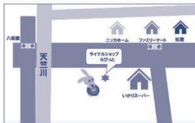
▲いかりスーパーさんの近く

●広がる無線機の可能性 無線機の特徴として、迅速な一斉呼出、個別呼出が可能で、しかも通話料はかからないため、社内や工場と事務所間などの業務連絡には携帯電話と比べてランニングコストの削減も期待出来ます。また災害時に携帯電話が輻輳して使用できない場合も無線機を装備することで短時間に安否確認、被害状況の把握が可能とのこと。グローバルメディアでは携帯無線機のレンタルも行っていきますので、防災対策を兼ねて試してみたいか、