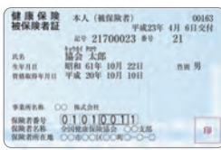
★この健康保険証をお持ちの方

その他 ProtoKey(すい臓のリスクを調べる血液検査)、 Lox-index(脳梗塞、心筋梗塞の発症リスクを評価する血液検査)、腫瘍マーカー検査等オプションあり 受診者50名以上で出張健診可能