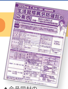
▲今号同封のチラシをご覧ください。