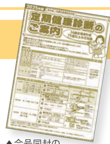
▲今号同封のチラシをご覧ください。

その他 ProtoKey(すい臓のリスクを調べる血液検査)、大腸がん検診(2回法)、 Lox-index(脳梗塞、心筋梗塞の発症リスクを評価する血液検査)、腫瘍マーカー検査等オプションあり 受診者50名以上で出張健診可能