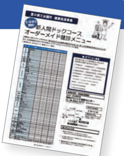
▲今号同封のチラシをご覧ください。

なお、受診者は併設のメディカルフィットネス エムズの入会金¥11,000が無料になります!