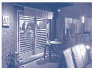
▲グランフロント近くの梅田店。平日にも関わらず取材時も満席でした。

毎朝市場で厳選した新鮮な素材を店内で揚げ、190円から楽しめる本格的な天ぷらとともに、旬の食材に合わせて厳選したワインを白・赤それぞれ3種ずつ490円から揃え、繊細な味わいのハーモニーを演出しています。また、前菜として新鮮な刺身や丹波野菜を使った副菜も用意し、幅広い味覚体験を楽しんでいただいています、とのこと。