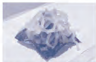
▲ワインと合わせるので素材の組み合わせや見た目がおしゃれな天ぷらたち。こちらは海苔の天ぷらにトロとたくあんが乗ったトロたく。

「天ぷらとワイン 大塩」は、アツアツの天ぷらとワインのマリアージュがコンセプト。