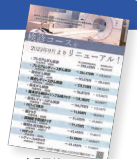
▲今号同封のチラシをご覧ください。