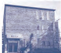
▲岡本会計事務所(本店)の外観

現在、所属税理士として勤務している岡本会計事務所は、アットホームで、挑戦したいことを応援してくれる素晴らしい環境であり、個