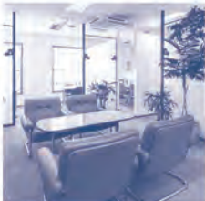
▲岡本会計事務所(本店)の事務所の風景

性豊かな職員が多いため、その中でもご自身の魅力を活かして組織に貢献できるよう、日々奮闘中とのこと。さらなるステージへ!