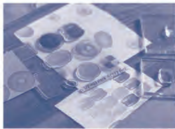
▲令和7年春の最新作「バイクドスイーツ」

●「狙ったところに押せる」 使い勝手の良いスタンプ 押し位置を正確に確認しながらスタンプを押すことができます。また、印刷用原版技術を利用してそのため微細な図柄も形成、捺印可能。最小でなんと0.35mmの線画の再現も可能で、非常に写実性にも優れています。フォトポリマー製のスタンプを透明なアクリル板に貼って使用するの