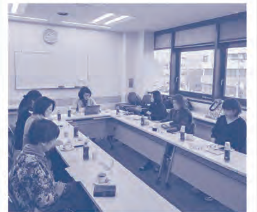
▲次年度の実施計画について審議する委員

去る3月14日、女性経営者ネットワーク特別委員会第8回会議が開催されました。会議では「豊中しゃべりバ!」2025年度の実施企画について審議され、闊達な意見交換がなされました。