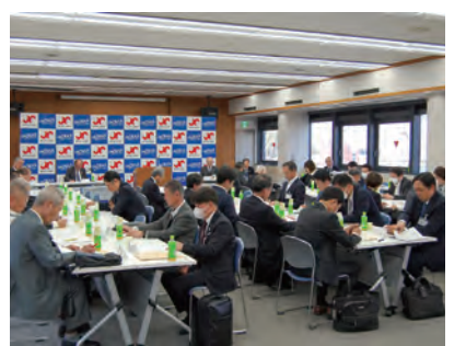
▲議件の審議を行う役員・議員

地域経済の新たな発展に繋げる。 3. チャレンジングな、地域づくり 「持続可能な地域経済の発展」を目指して、頻発する自然災害や感染症、サイバー攻撃などにより、企業による事業活動の継続に支障をきたさないよう、省エネや脱炭素経営を踏まえた事業継続力の強化支援に取り組み、地域経済の強靱化に繋げる。