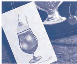
▲写真のような高精度の「THEクリームソーダ」

●「狙ったところに押せる」 使い勝手の良いスタンプ スタンプやハンコが狙った位置に押せずちよつともややや...という経験をお持ちの方も多いと思います。「TO-MEI HAN」はスタンプも台も透明なので、慣れていない人でも