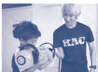
▲子どもの体幹トレーニングも指導しています。

●「狙ったところに押せる」 使い勝手の良いスタンプ 今後は国内外のセレクト文具店で販売するほか、百貨店等の文具イベントでの出店販売も多く、昨年は40を超すイベントに参加し、一昨年と比べ30%を超える売上増加等、文具ファンの女性から特に注目を集めた「TO-MEI HAN」。今後はInstagramを活用した広告展開の加速や自社ECでの販売の強化